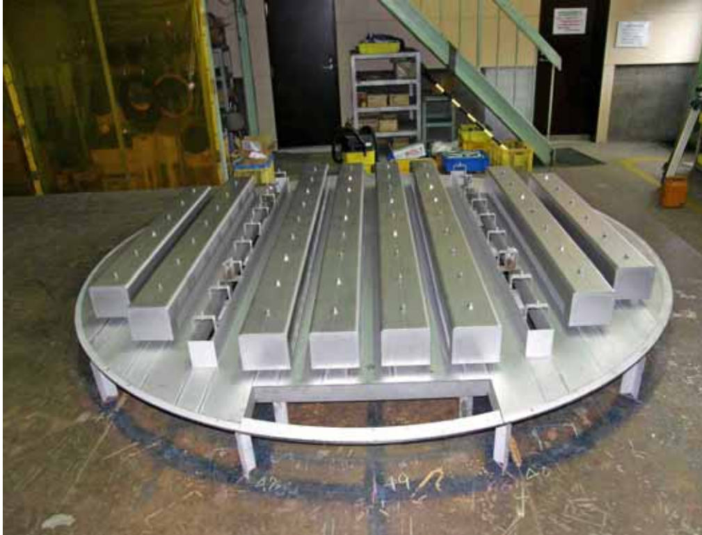
シーブトレイ 1,000 SUS304